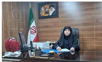
دانشگاه افزود: این مهم به همت اعضا محترم شورای هسته گزینش با تشکیل جلسات متعدد

و منظم شورا و انجام تعداد ۱۳۸۴ مصاحبه و ۶۷۳۵ تحقیق توسط کارگزاران گزینش به دست آمده و جا دارد از زحمات تمامی اعضا و کارگزاران محترم که این کارگزاران و با تمام سختی هایی که ماهیت کار گزینش دارد، اهتمام به همکاری با این مدیریت داشته اند تقدیر و تشکر نمایم. وی اظهار داشت: با توجه به اهمیت آموزش قوانین به کارکنان، پس از اخذ مجوزهای لازم، دوره آموزشی قانون گزینش و آیین نامه اجرایی آن با احتساب ۱۶ امتیاز شغلی برگزار گردید که