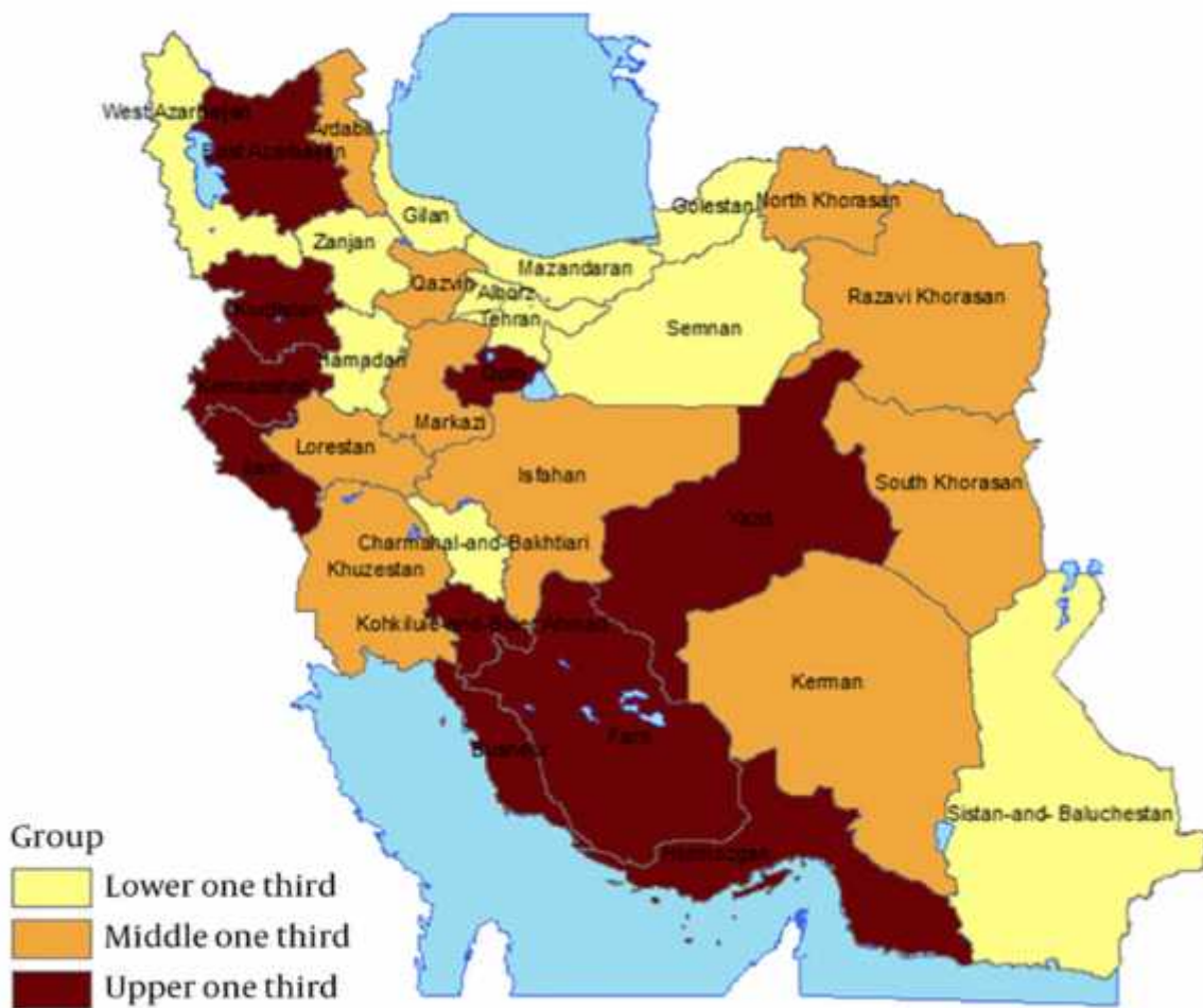
شکل شماره ۲ - پراکندگی سقط هایی که از نظر مصاحبه شونده دارای دلایل پزشکی بوده است در استان های کشور در موارد مستند به دلایل پزشکی، استان های یزد، فارس، هرمزگان، بوشهر، کهگیلویه و بویراحمد، قم، کردستان، کرمانشاه، ایلام و آذربایجان شرقی از بالاترین میزان ها برخوردار بوده اند. در موارد سقط بدون دلایل پزشکی، استان های فارس، هرمزگان، اصفهان، کهگیلویه و بویراحمد، لرستان، کرمانشاه، آذربایجان شرقی، آذربایجان غربی و گیلان از بالاترین میزان ها برخوردار بوده اند. شکل های شماره ۲ و شماره ۳.