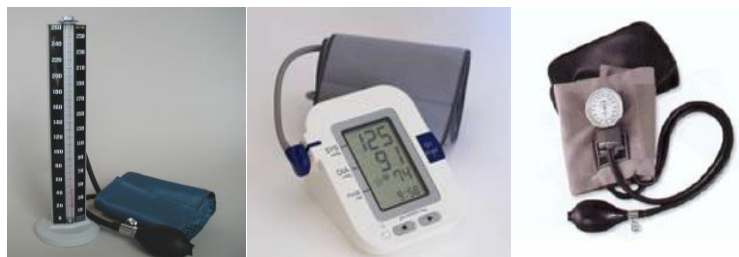
شکل ۲: انواع دستگاه های فشارسنج (عقربه ای، جیوه ای و دیجیتال)

نشت کیسه هوا و لوله لاستیکی به علت ترک یا ساییده شدن لاستیک، سبب اندازه گیری نادرست فشارخون می شود. کیسه و دو لوله لاستیکی باید سالم و بدون نشت باشند. محل های وصل باید غیر قابل نفوذ باشند و براحتی از هم جدا شوند. مشکلات پیچ تنظیم هوا (دریچه کنترل) نیز یکی دیگر از عوامل ایجاد خطا در دستگاه فشارسنج است. دریچه های ناقص سبب نشتی هوا می شوند و کنترل تخلیه هوا و کم کردن فشار مشکل می شود. این مشکل می تواند باعث کم نشان دادن فشارخون سیستول و یا بیشتر نشان دادن فشارخون دیاستولی شود. نقص در دریچه کنترل براحتی با پاک کردن فیلتر یا تعویض دریچه کنترل برطرف می شود.