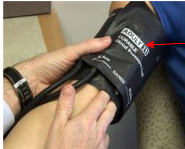
مشخصه اندازه (نوع) بازبند