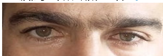
شکل ۳- از بین رفتن آنیزوکوریا و کاهش پتوز پس از شروع درمان